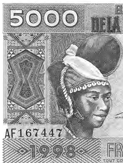
4. Une illustration qui circule : la « femme au cimier » sur un billet de banque.

Ainsi, quelle que soit la région, l'assignation à sa tête d'une figure unique de résistant procède d'une invention idéologique mais elle permet de mettre à égalité les quatre régions 1 .