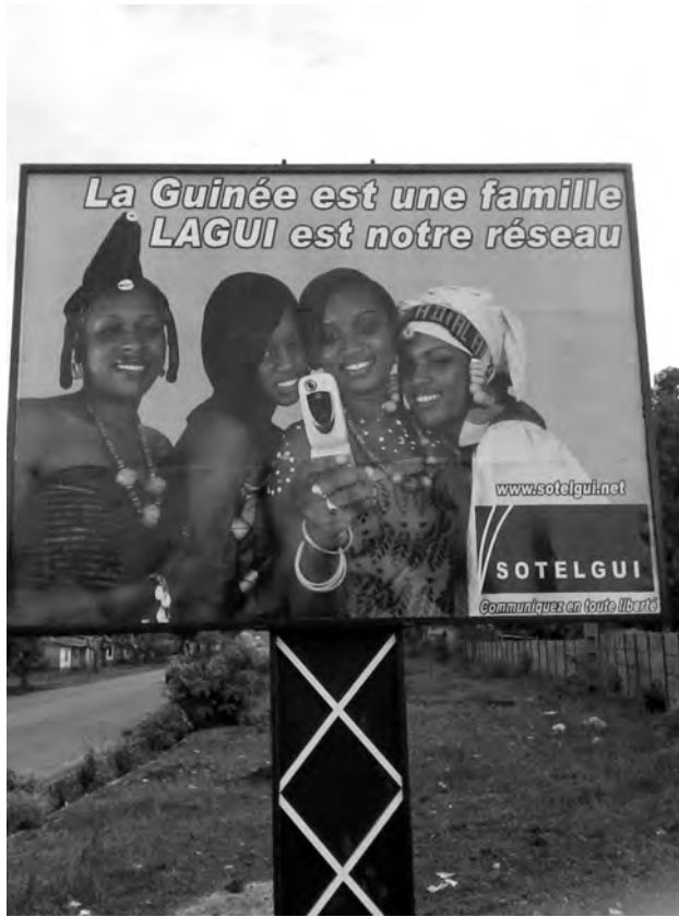
1. Panneau publicitaire de la compagnie de téléphone Sotelgui, Conakry, 2008.

de Frédéric Le Play (1806-1882), et de démarche administrative. La fin du 19 e siècle, contemporaine de l'affirmation coloniale, coïncide avec la mise en avant d'un nouveau « mode de division du globe », la région, sur des bases naturalistes, autant géographiques que sociales, et non plus historico-politiques ou centrés sur les bassins fluviaux 1 . Imprégnés des théories qui dominent en France au tournant du 20 e siècle, voyageurs et publicistes découvrant la Guinée tout autant qu'administrateurs s'évertuent à proposer une vision de la colonie cadrant avec le modèle