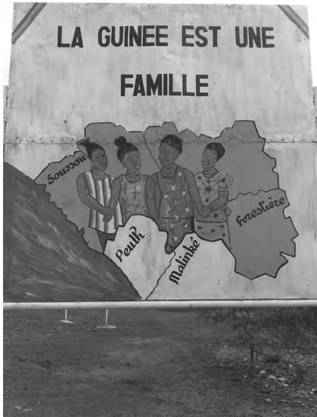
2. Une représentation de la Guinée, Conakry, 2008.

ques. Sans survaloriser l'agent colonial dans ce processus de nomination et d'organisation des espaces et des populations, il est important de mettre à jour la genèse de cet héritage et d'explorer le devenir. Cette démarche d'archéologie du savoir – pour reprendre l'expression de Michel Foucault –, par laquelle peuvent être identifiés non seulement les sources mais aussi le substrat intellectuel, permet de comprendre les phénomènes de perpétuation, de modification et de réappropriation des catégories.